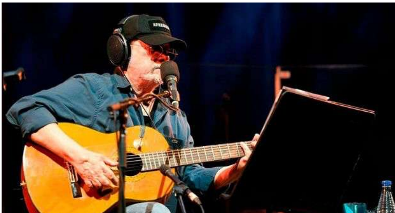
Silvio Rodríguez ofreció este sábado un concierto en el Wizink Center de Madrid.