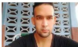
"NO HAY QUIEN ME CALLE", DICE UN PROFESOR