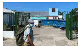
EL FIASCO DE LAS AZULITAS CUBANAS