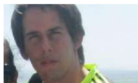
CUBIZA SILENCIA LA MUERTE DE UN TRABAJADOR