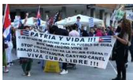
CUBANOS INCREPAN A SILVIO RODRÍGUEZ EN MADRID