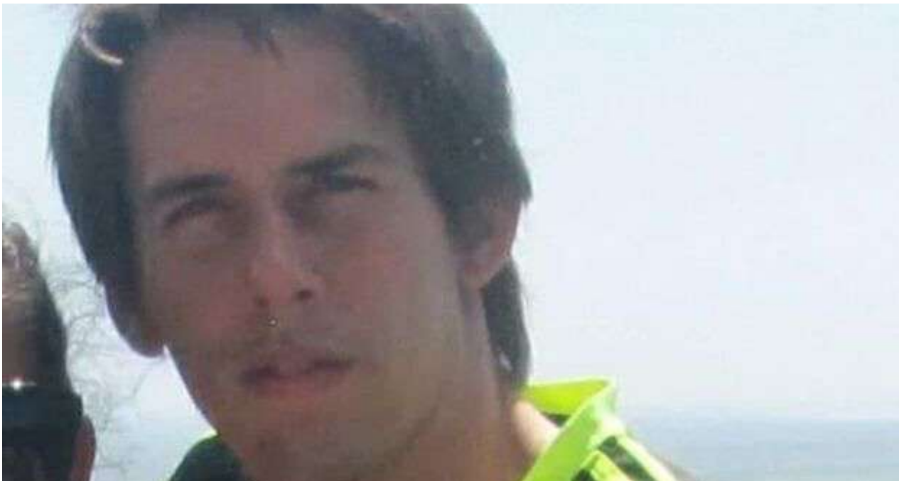
Díaz Sistachs se graduó de Ingeniería Mecánica en el Instituto Superior Politécnico José Antonio Echeverría.