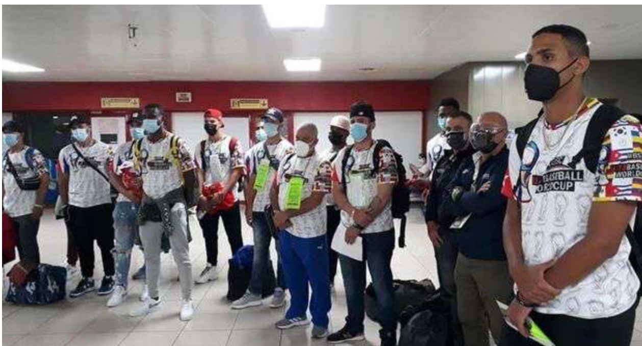
En la imagen los 12 peloteros que regresaron este lunes a La Habana.

Una selección con lo mejor de la semana del primer diario independiente hecho en Cuba