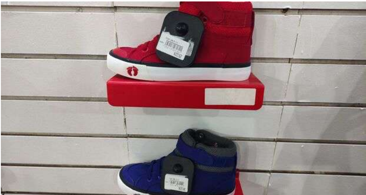
Vidriera de la zapatería Sport, en la plaza Carlos III de La Habana.